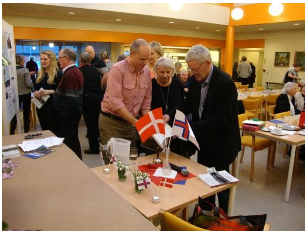
Alt i alt en rigtig vellykket eftermiddag, ikke mindst for de mange fremmødt med færøske rødder.