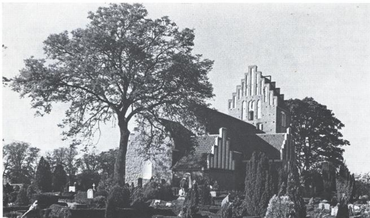
Bregninge kirke, fotograferet fra kirkemuren ved landevejen en smuk oktoberdag