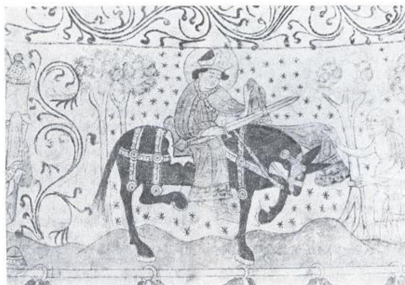
Biskop Martin af Tours