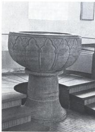
Døbefont af gotlandsk kalksten fra ca. 1300