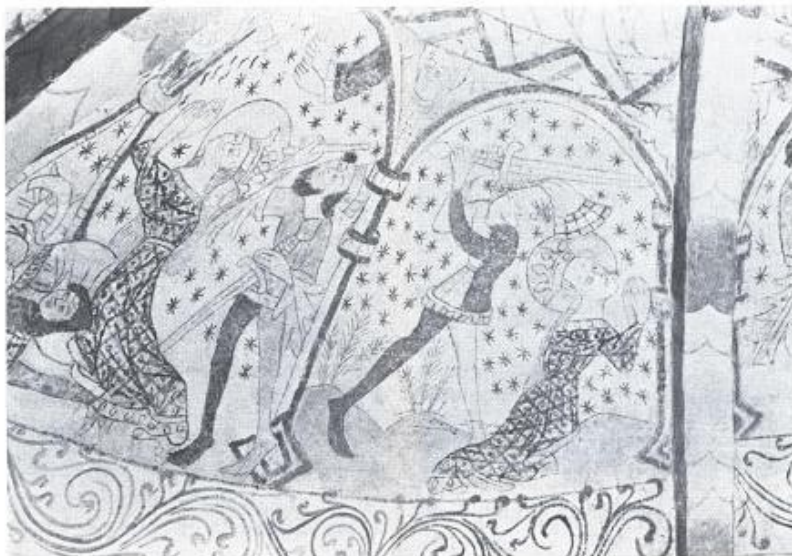
Fra Katharina-legenden i sakristiet

Som man kan forstå, er der i Bregninge kirke rige muligheder for et studium af middelalderlige kalkmalerier, og man håber da også, at der om ikke al for lang tid kan udkomme en udførlig beskrivelse af malerierne udgivet af Nationalmuseet og menighedsrådet.