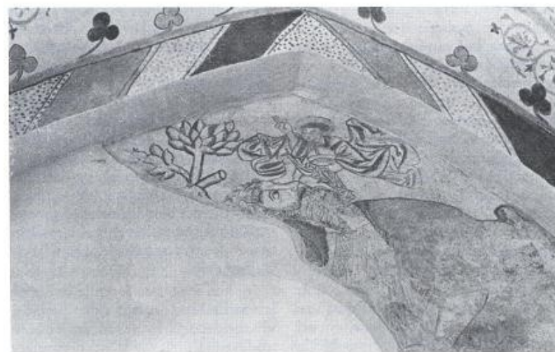
Den hellige Kristoffer bærer Jesusbarnet over en bæk