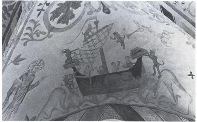
De søfarendes helgen, Nicolaus af Bari, frelser et skib i havsnød