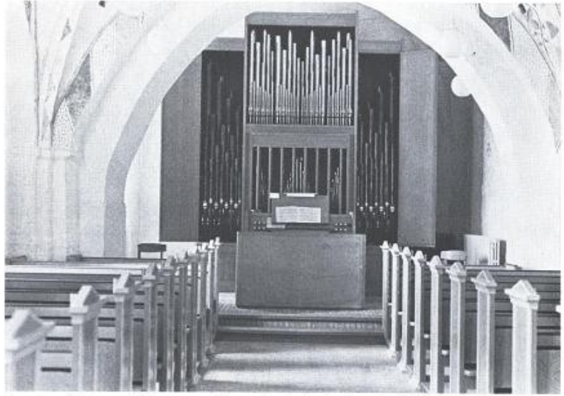
Bregninge kirkes orgel, 14 stemmer. Bygget hos Frobenius, Lyngby, 1973