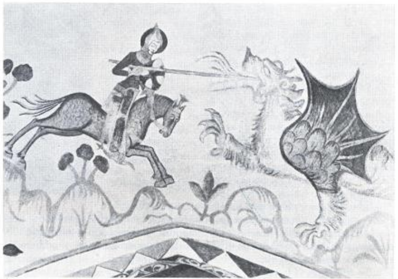
Sct. Jørgens kamp med dragen