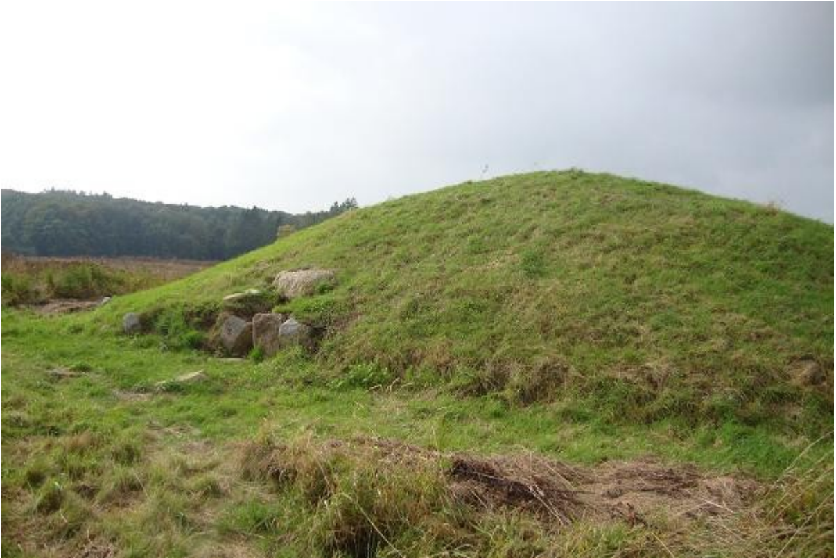
Højen set mod nordvest fra nabohøjen