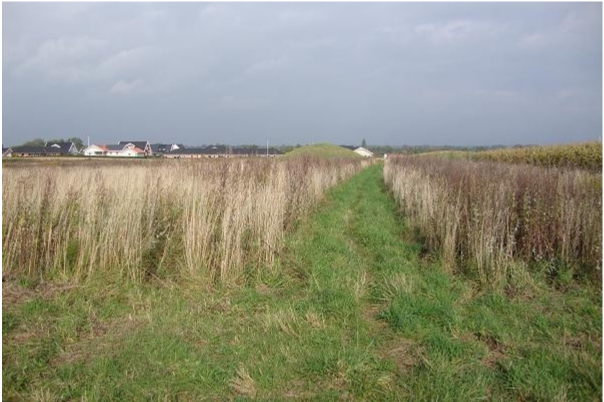
Indgang til gravkammeret