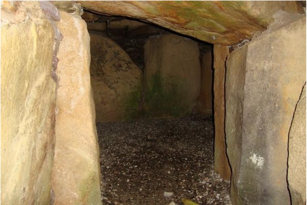
Afstivning af loftet i gravkammeret